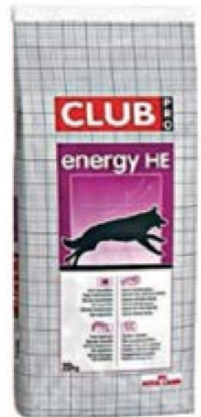
Presentación especial de 20 Kilos.